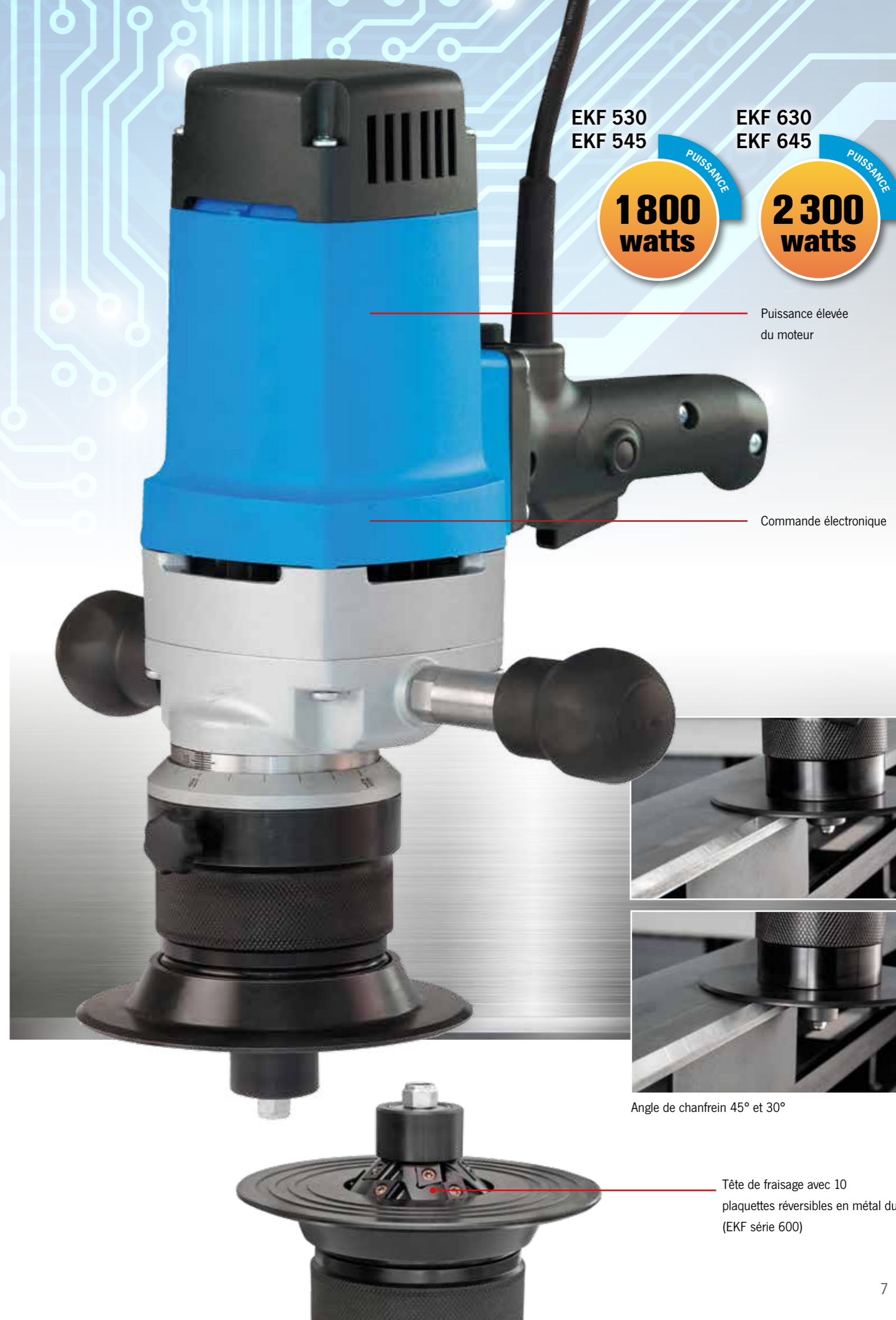
Angle de chanfrein 45° et 30°